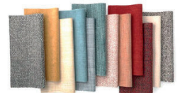
Tapizado en tela