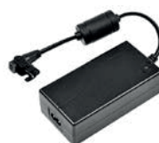
Con batería recargable