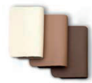
Tapizado en piel