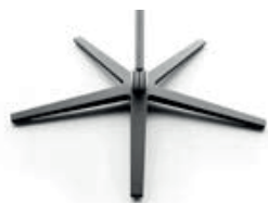
Base estrella negra