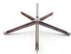
Base estrella madera