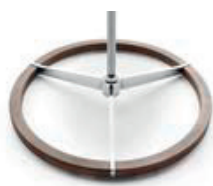
Base redonda madera