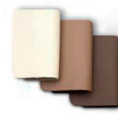
Tapizado en piel