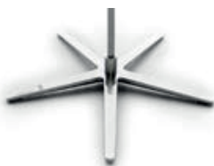
Base estrella cromada