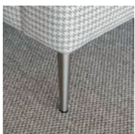
Pata tacón pulido