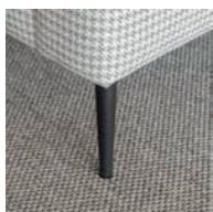
Pata tacón grafito