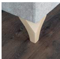
Pata madera natural