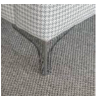
Pata escuadra cromada