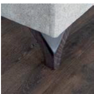
Pata madera wengué