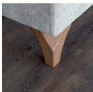
Pata madera nogal