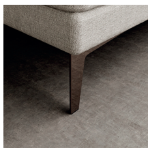
Pata níquel negro (16 cms. altura)