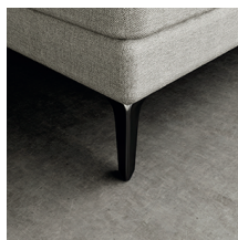
Pata metálica mate (13,5 cms. altura)