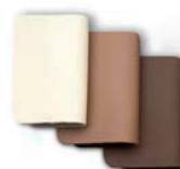
Tapizado en piel