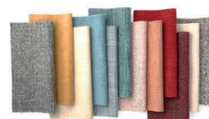
Tapizado en tela